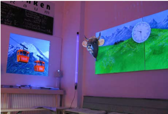
Inhalt und Sinn / Klötze und Schinken (mittags um 13 Uhr)