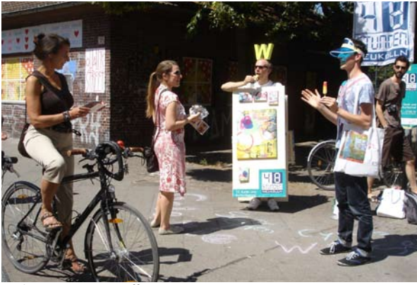
Galerie Wiese / Steffen Cyrus *