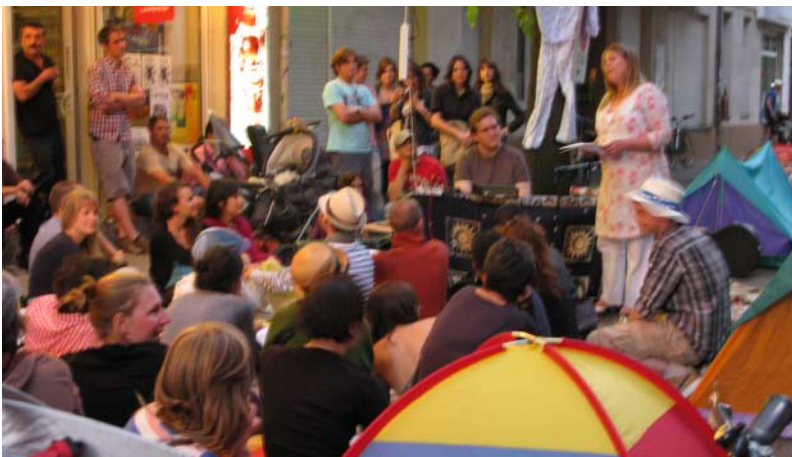
Schlaflieder im Zeltlager von Den Kunden / Galerie Späti International – Foto: Antje Gerhardt