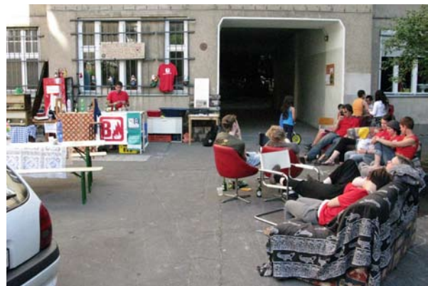
KLAUS! LEBT! IDEAL (Sonntag, 17 Uhr) / BRAND / Idealhöfe

Fotos: Antje Gerhardt, außer Foto*: Christian Wundelich und Foto**: www.flowmo.de. Die Nutzung ohne Rücksprache mit den Urhebern ist untersagt.