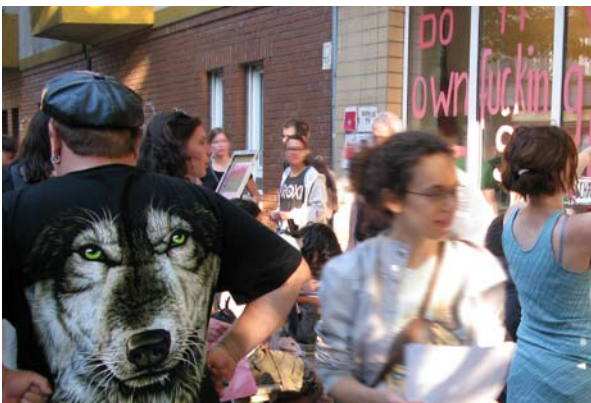
DYOFS / SDW-Neukölln