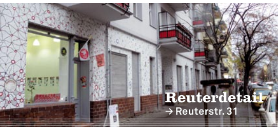
Reuterdetail → Reuterstr. 31

→ Read on, my dear – Lesebühne, donnerstags ab 20.30 Uhr (Eintritt kostenlos, Austritt mit Hut/ Spendenbasis)