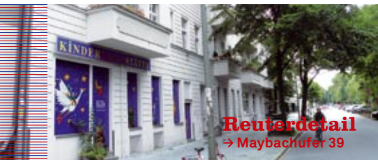
Reuterdetail → Maybachufer 39

Infos T: 01578 727 69 91, www.yogawave.de